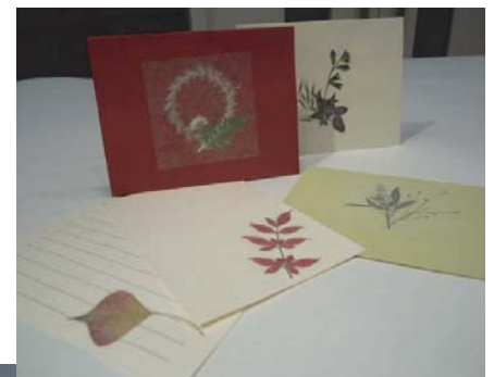
■ 押花カードとハガキ